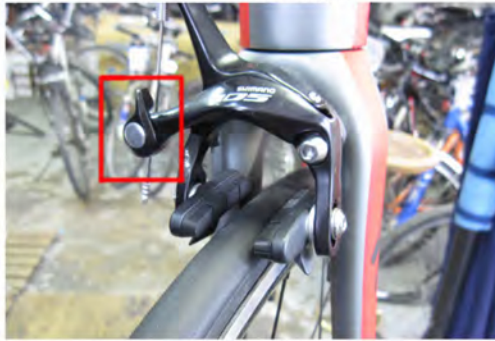
Immagine 9: Spazio giusto tra i pattini con la linguetta alzata sulla bicicletta da strada