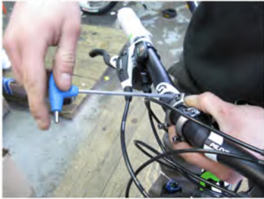
Immagine 1: Montaggio del manubrio