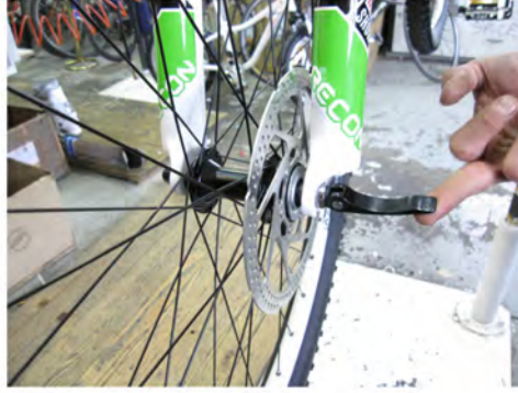
Immagine 7: Montaggio della ruota anteriore