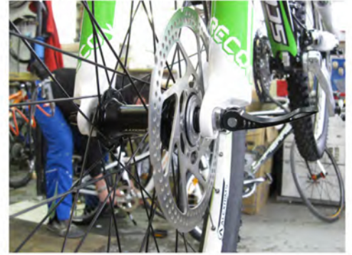
Immagine 7/1: Montaggio della ruota anteriore