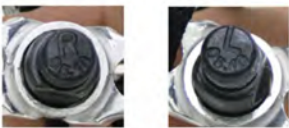
Immagine 11: Segno per pedale sinistro (L) e destro (R)