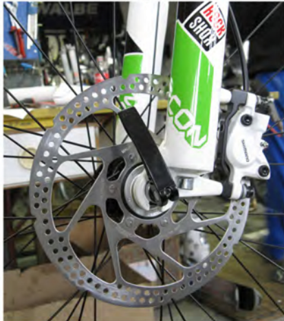
Immagine 8: Fissaggio corretto del sgancio rapido