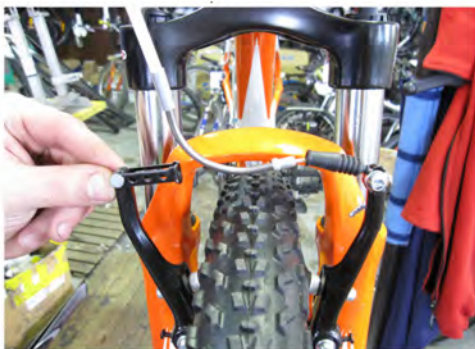
Immagine 3: freni V-brake