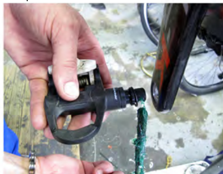
Immagine 12: Applicazione del grasso sui pedali