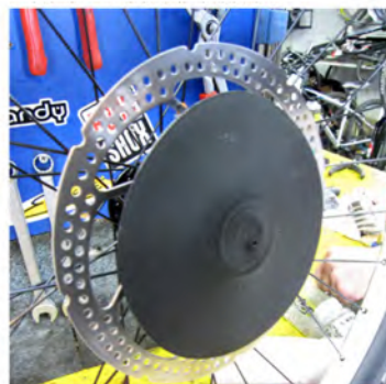
Immagine 4: protezione plastica