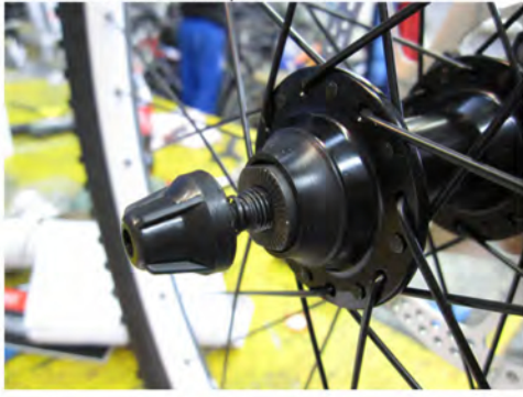
Immagine 6: Inserimento corretto del sgancio rapido